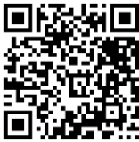
【海外からのご連絡先】

■海外からのご連絡先は、別紙「 海外旅行傷害保険のあらまし 海外からのご連絡先 」をご参照ください。 ( https://www.saisoncard.co.jp/pdf/futai_hoken/overseas.pdf )